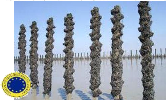
Bouchoit/ブショ: 波打ち際に植えられた杭を利用した伝統的な養殖方法